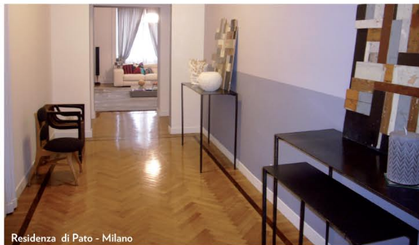
Residenza di Pato - Milano