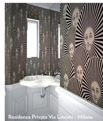
Residenza Privata Via Lincoln - Milano